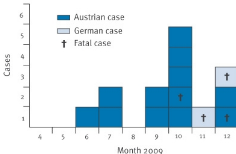
Outbreak cases of listeriosis by onset of illness, Austria and Germany, 2009 (n=14)

Im Zusammenhang mit einem lebensmittelbedingten Krankheitsausbruch, hervorgerufen durch Listeria monozytogenes SG 1/20a in einem Käse der Steirischen Erzeugerfirma Proactal, war der Minister nicht in der Lage, das gesetzlich erforderliche Risikomanagement im Sinne der österreichischen Bevölkerung umzusetzen.