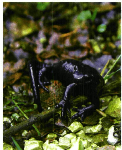
Ruhe und Gelassenheit