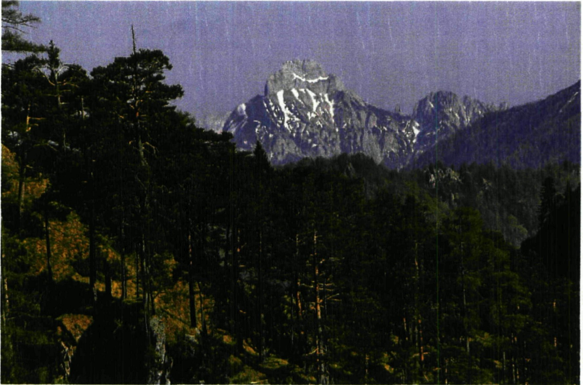
Kalkalpen und Gesäuse – ökologischer Verbund