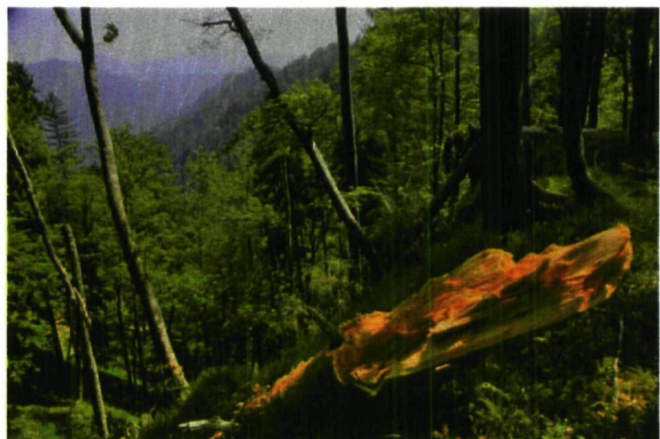
Waldwildnis mit vielfältiger, ökologischer Wirkung

Wildnis ist ein großes zusammenhängendes Gebiet, in welchem die Natur sich selbst überlassen ist. Menschliche Eingriffe sind zur Erreichung der Nationalpark Ziele möglich.