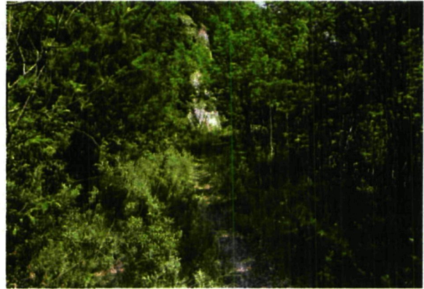
Natürliche Prozesse auf ehemaligen Forststraßen