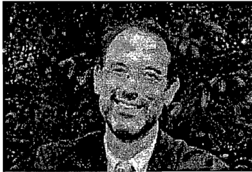
Univ.-Prof. Dr. Heinz Fassmann Vorsitzender des Expertenrates für Integration

erscheint. Das Bild eines Trichters eignet sich als Vergleich für den Arbeitsauftrag vom breiten und abstrakten NAP zum konkreten 20-Punkte-Programm.