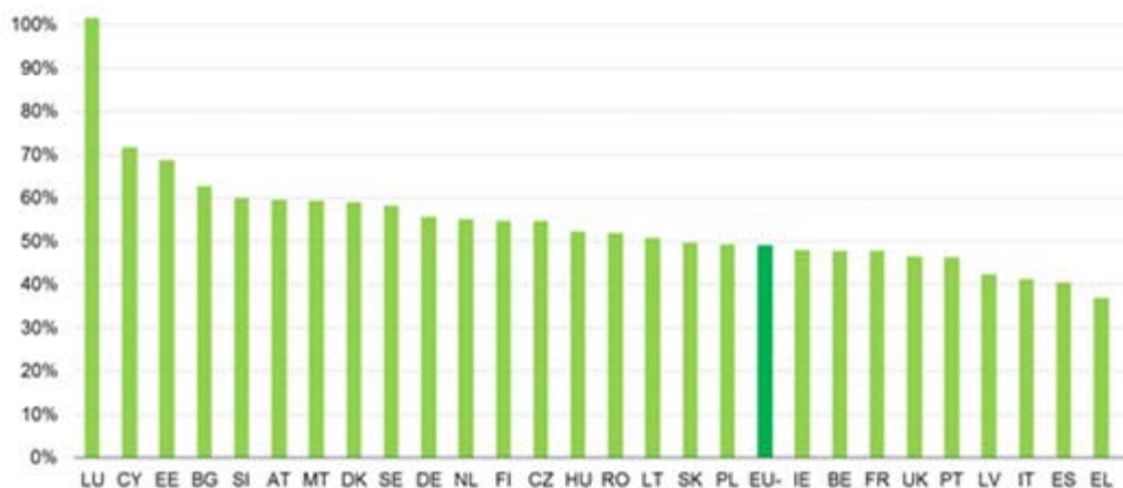
Schaubild 1. Tatsächliches MwSt.-Aufkommen im Jahr 2011 (in % des theoretischen Aufkommens zu Normalsätzen)

Die MwSt.-Aufkommensquote entspricht den tatsächlichen MwSt.-Einnahmen geteilt durch das Produkt des MwSt.-Normalsatzes und des Netto-Inlandsverbrauchs. Der hohe Wert für Luxemburg ist durch die Bedeutung der MwSt. auf Verkäufe an Gebietsfremde zu erklären.