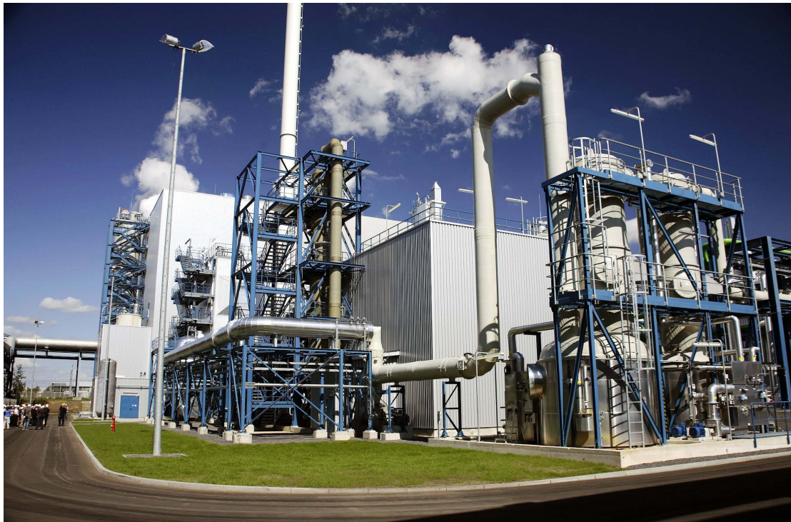
CCS-Pilotanlage in Jämschwalde, Deutschland

Die wichtigsten technischen Erfolge für die CO 2 -Abscheidung in Compostilla (Spanien) konnten mit dem Bau der 30-MW-Entwicklungsanlage für die Oxyfuel-Technologie erzielt werden, die im Verlauf dieses Jahres in Betrieb gehen wird. Im Bereich der CO 2 -Speicherung sind als Hauptmeilensteine die strukturelle Analyse und strategische Studien für die Standortbewertung und die Charakterisierung von Reservoirs zu nennen. Zur Bestimmung der Eigenschaften der unterirdischen CO 2 -Speicherstätte wurde eine seismische 3D-Erhebung vorgenommen und wurden magnetotellurische 3D-Daten eingeholt.