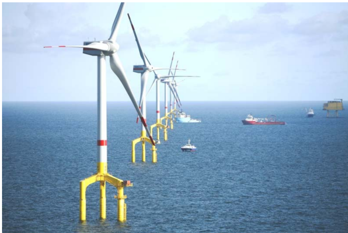
Multi-MW-Turbinen und Offshore-Fundamentstrukturen in der Anlage Bard I in der deutschen Nordsee, kofinanziert vom EEPR

Ein weiteres Projekt mit großer Bedeutung für die europäische Industrie ist ein Prüfzentrum für Offshore-Windturbinen und –strukturen, das in Aberdeen angesiedelt werden soll. In Fragen der Genehmigung und der Rechts- und Unternehmensstruktur für das Management der Prüfanlagen beispielsweise ist man inzwischen entscheidend weitergekommen.