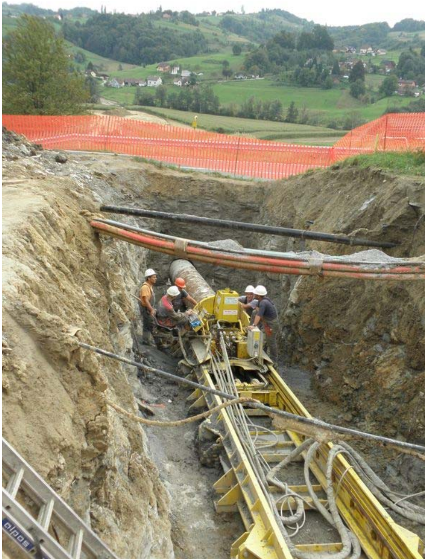
Nachrüstung des Gasfernleitungsnetzes in Slowenien zwischen der slowenisch-österreichischen Grenze und Ljubljana

Das Programm bot die einzigartige Gelegenheit, strategische EU-Investitionsvorhaben anzustoßen, insbesondere in einer Zeit, in der rein kommerzielle Erwägungen – in Kombination mit der Wirtschafts- und Finanzkrise – neue Investitionen bremsen.