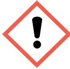
Abbildung 4: Neues (der CLP-Verordnung entsprechendes) Piktogramm für Gesundheitsgefahren, 59 % der Befragten vertraut aber nur von 11 % verstanden