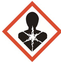
Abbildung 3: Neues (der CLP-Verordnung entsprechendes) Piktogramm für „erhebliche Gesundheitsgefahr“, sehr geringer Wiedererkennungswert für die Öffentlichkeit und sehr geringes Verständnis seiner Bedeutung (20 % bzw. 12 %)

Es überrascht nicht, dass neue Piktogramme gemäß der CLP-Verordnung, die keinen ähnlichen „Vorläufer“ in den früheren EU-Rechtsvorschriften haben, in der Öffentlichkeit kaum bekannt sind und verstanden werden (siehe Abbildung 3).