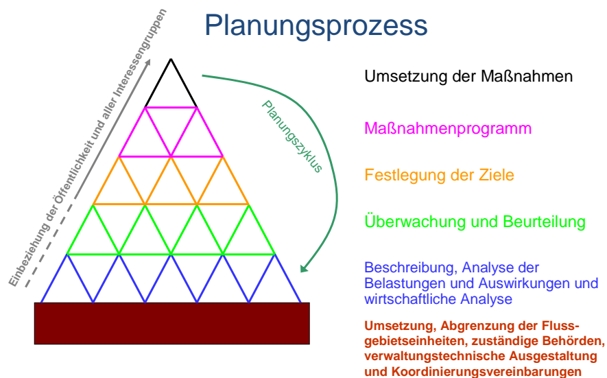
Abbildung 1: Schematische Darstellung des Planungsprozesses gemäß Wasserrahmenrichtlinie

Für die Wirksamkeit des Planungsprozesses und die Angemessenheit und Zuverlässigkeit des Bewirtschaftungsplans ist es unerlässlich, dass jeder Zwischenschritt sorgfältig durchgeführt wird. Wenn z. B. bei der Ausgangsanalyse eine signifikante Belastung übersehen wird, erfolgt wahrscheinlich auch im Rahmen der Überwachung keine Bewertung, und das Maßnahmenprogramm wird keine geeigneten Gegenmaßnahmen enthalten.