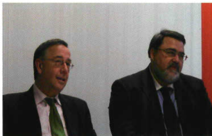
Theodor Thanner, Igor Artemiev

Der Generaldirektor der ungarischen Wettbewerbsbehörde, Zoltan Nagy, hat am 14.10.2010 Wien besucht. Im Zentrum der bilateralen Gespräche standen die weitere Zusammenarbeit der beiden Nachbarbehörden. Die ungarische Kartellbehörde unterhält gemeinsam mit der OECD das Partnerprojekt „Regional Centre for Competition in Budapest“ (RCC). In diesem Rahmen gab es bereits mehrere gemeinsame Projekte. Der gegenseitige Austausch beschäftigte sich auch mit der Merger Plattform im Rahmen des Marchfeld Competition Forums (Informationsaustausch und Zusammenarbeit in Zusammenschlussfällen).