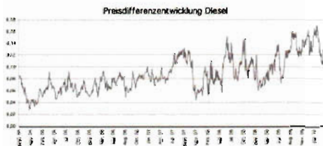
Abbildung 2: Preisdifferenz Diesel an Nicht-Autobahn- und Autobahntankstellen in Österreich