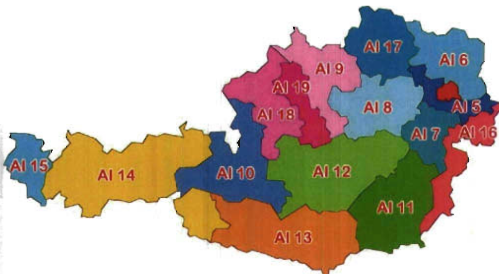
Aufsichtsbezirke in Österreich (ohne Aufgliederung für Wien)