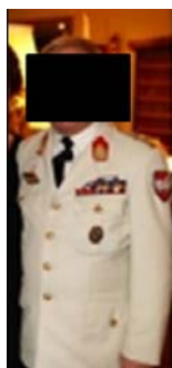
Ball der VP Groß-Enzersdorf 2012

In diesem Zusammenhang richten die unterfertigten Abgeordneten an den Bundesminister für Landesverteidigung und Sport nachstehende