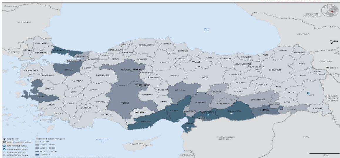
Verteilung der syrischen Flüchtlinge in der Türkei nach Provinzen