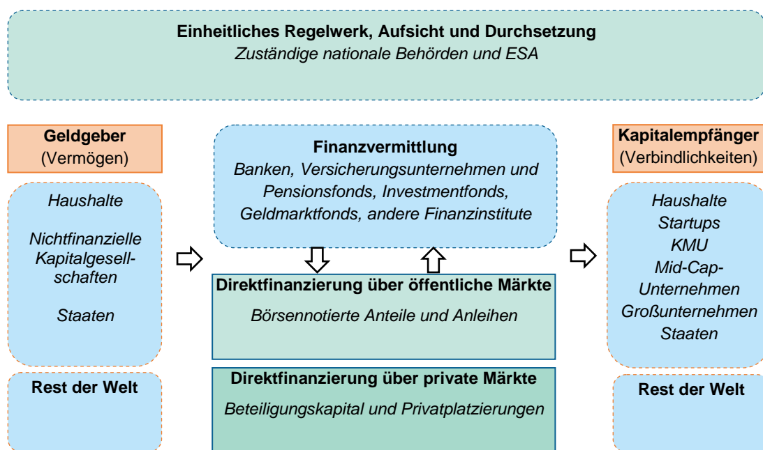
Abbildung 1: Schematischer Überblick über die Kapitalmärkte im Finanzsystem

In den letzten Jahrzehnten sind die Kapitalmärkte in der EU stark gewachsen. So stieg die Börsenkapitalisierung in der EU von 1,3 Billionen EUR im Jahr 1992 (22 % des BIP) bis Ende 2013 auf insgesamt rund 8,4 Billionen EUR (ca. 65 % des BIP) an. Die ausstehenden Schuldverschreibungen erreichten im Jahr 2013 einen Gesamtwert von über 22,3 Billionen EUR (171 % des BIP), im Vergleich zu 4,7 Billionen EUR (74 % des BIP) im Jahr 1992 3 .