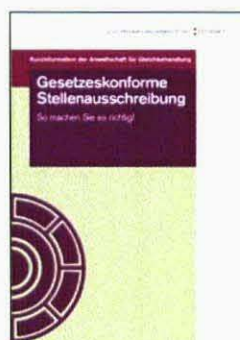
Altersdiskriminierung in der Arbeitswelt