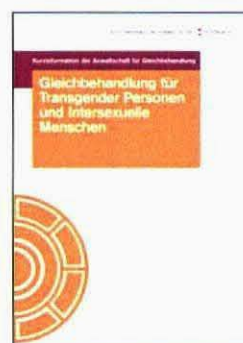
Gleichbehandlung für Transgenderpersonen und intersexuelle Menschen