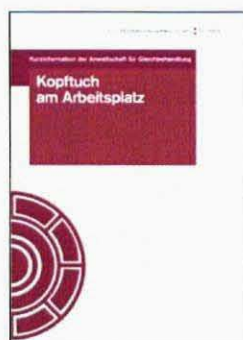
Kopftuch am Arbeitsplatz