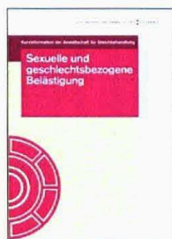
Sexuelle und geschlechtsbezogene Belästigung

Bisher sind Kurzinfos zu folgenden Themen erschienen: