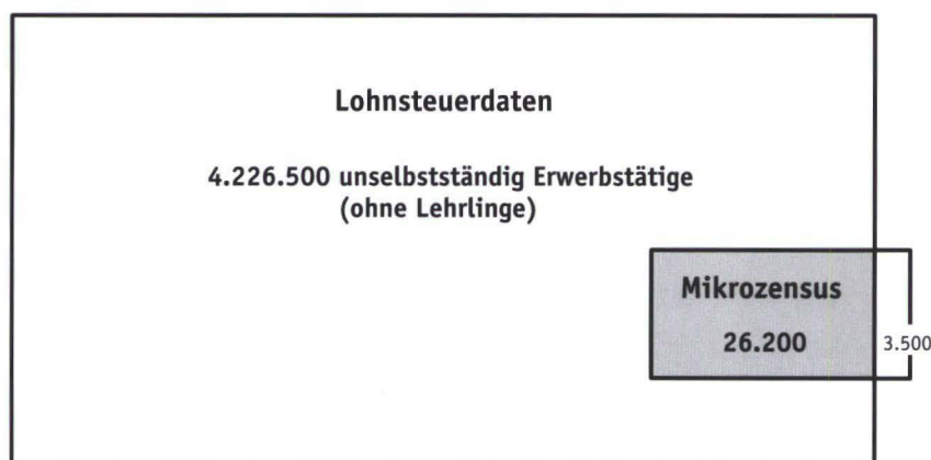
Grafik 48: Lohnsteuerdaten × Mikrozensus 2015

Die Schnittmenge LSt × MZ besteht somit aus allen unselbstständig Erwerbstätigen (ab 15 Jahren mit Wohnsitz in Österreich, ohne Lehrlinge), die im Referenzjahr in mindestens einem Quartal im Mikrozensus befragt und im Verknüpfungsvorgang in den Lohnsteuerdaten gefunden werden konnten (vgl. Grafik 48).