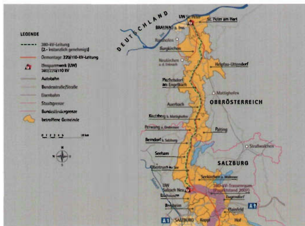
Abbildung 5: Trasse der Salzburgleitung 1

56 Der Bau des Teilstücks der Salzburgleitung 1 zwischen St. Peter und dem Umspannwerk Salzach schließt eine Lücke im 380 kV-Höchstspannungsring des Austrian Power Grid AG-Netzes und stellt eine hochrangige Verbindung nach Deutschland dar. Die Leitung erstreckt sich von der oberösterreichischen Landesgrenze zu Deutschland zum Umspannwerk nördlich von Salzburg. Ihre Länge beträgt rd. 46 km, die Leitungstrasse berührt sechs Anrainergemeinden in Salzburg.