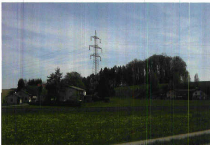
Abbildung 1: Siedlungsentwicklung in der Trasse der 220 kV-Leitung im Bestand