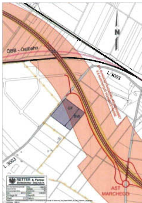
Abbildung 2: Lage des im Vorprojekt ausgewiesenen § 14-Korridors der S 8 Marchfeld Schnellstraße in Marchegg