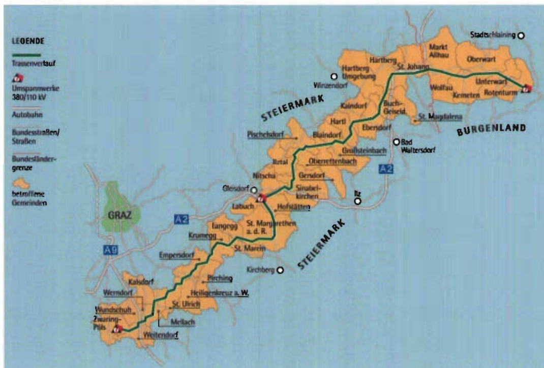
Abbildung 6: Trasse der Steiermarkleitung