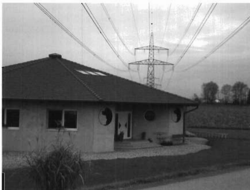
Abbildung 7: Gewerbebetrieb unterhalb der Steiermarkleitung

(2) Bereits während der Errichtung, aber auch nach Fertigstellung der Steiermarkleitung wurden Bauvorhaben bzw. eine Umwidmung eines Waldstücks in Gewerbegebiet im Servitutstreifen der Leitung (rd. 30 m beiderseits der Leitungsachse) beantragt. Für bereits gewidmetes Bauland im Trassenbereich von elektrischen Leitungsanlagen bestand im Baubewilligungsverfahren bei Einhaltung der elektrotechnischen Sicherheitsvorschriften kein Bauverbot. 77 Laut Dienstbarkeitsübereinkommen mit den von der Steiermarkleitung betroffenen Grundeigentümern war die Zustimmung der Austrian Power Grid AG vor der Bauführung einzuholen. Im Jahr 2008 bestätigte die Austrian Power Grid AG im Bauverfahren zur Errichtung eines Gewerbebetriebs direkt unter der Leitung die Einhaltung des sicherheitstechnischen Mindestabstandes. Die Stellungnahme im Jahr 2009 zu der geplanten Umwidmung in Gewerbegebiet verwies auf die Notwendigkeit der Freihaltung von Infrastrukturkorridoren und auf den strengen Vorsorgewert gegen elektromagnetische Strahlung.