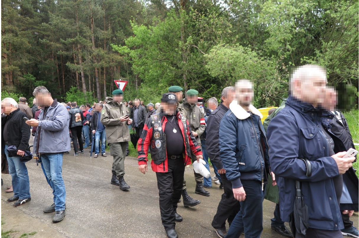
Bundesheer-Angehörige auf der Ustaša-Feier, Mai 2016.