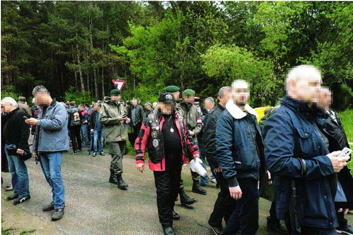
Bundesheer-Angehörige auf der Ustaša-Feier, Mai 2016.