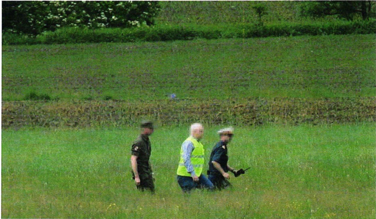
Bundesheer-Angehöriger neben dem behördlichen Einsatzleiter während der Ustaša-Feier, eingeflogen mit einem Polizeihubschrauber, Mai 2015.