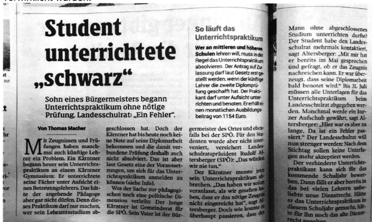
Kleine Zeitung, Kärnten Ausgabe vom 12.10.2017

Die Rolle des Landesschulrates für Kärnten ist neben den aufklärungsbedürftigen Vorkommnissen an der HTL Ferlach auch im unten angeführten Fall unklar. Fraglich ist, ob durch die Tätigkeiten Straftatbestände (zB. Missbrauch der Amtsgewalt) verwirklicht wurden.