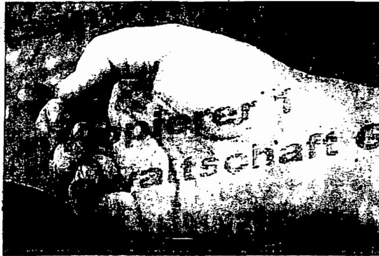
Abbildung 6 zeigt die linke Hand des Leichnams vor der Schusshandabnahme von der Innenseite. An der Hand sind Blutspritzer ersichtlich. (S 4/14)

Abbildung 5 zeigt die rechte Hand des Leichnams vor der Schusshandabnahme von der Innenseite. An der Hand sind Blutspritzer ersichtlich.