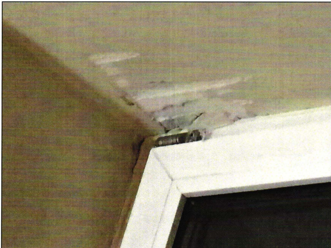
Desolate Decken mit Schimmelspuren