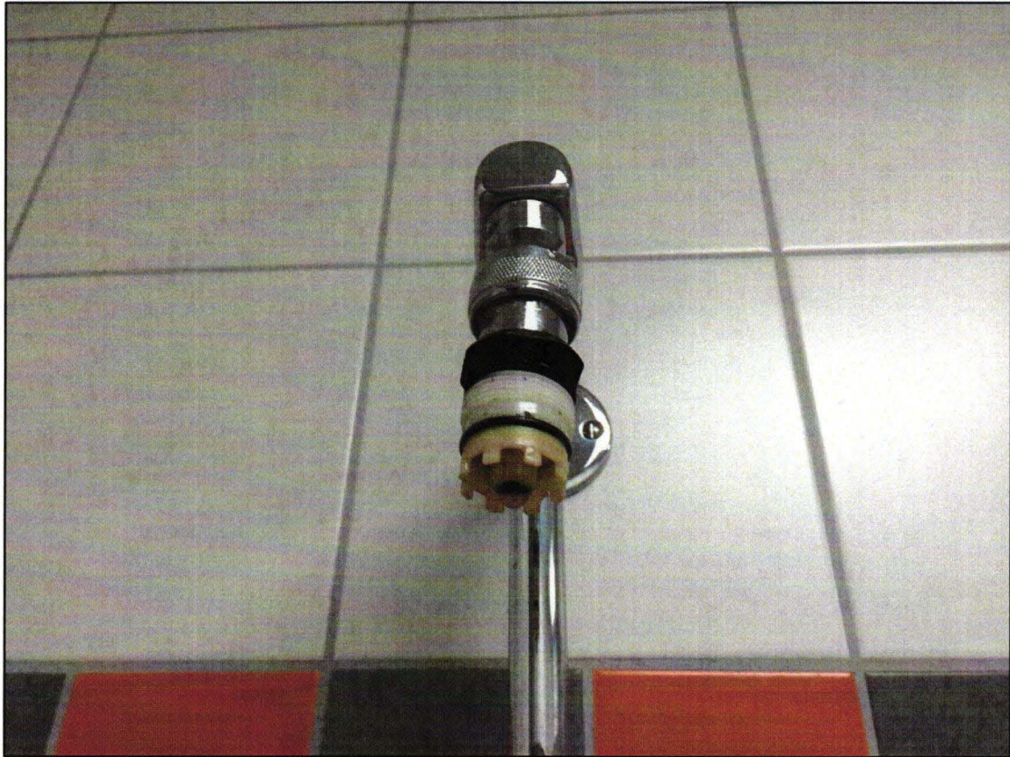
Duschen ohne Duschköpfe