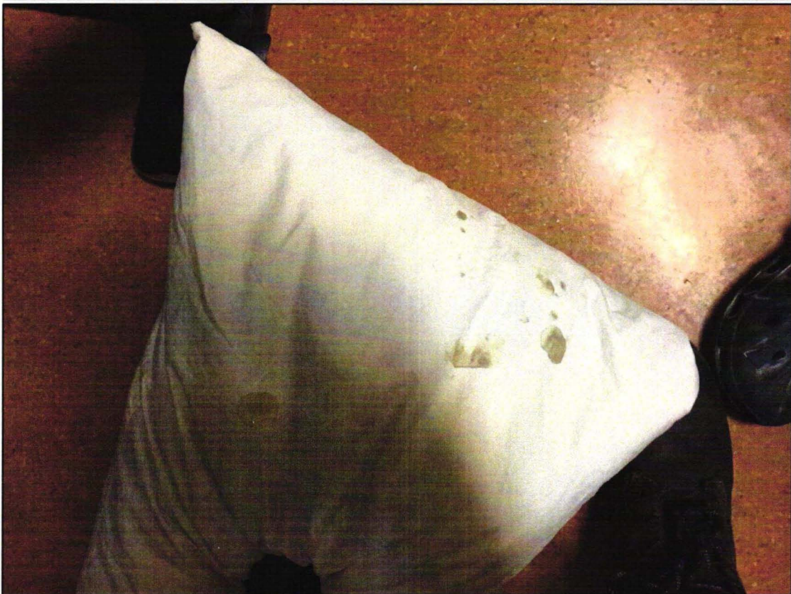
Vollkommen verschmutztes Bettzeug mit Spuren von Blut und Erbrochenem