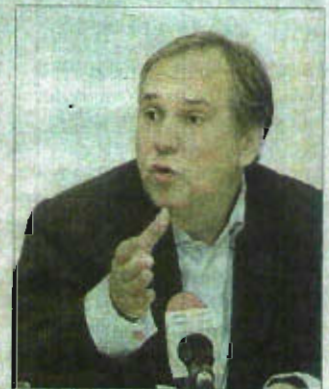
Nationalrat Walter Rosenkranz.

Und das natürlich auch im Hinblick auf die bevorstehende EU-Wahl: „Das Hemmungslose Ausnutzen unseres teuer aufgebauten Sozialsystems muss auch in der EU abgedreht werden. Die Freiheitlichen werden sich klar gegen diesen Sozialtourismus positionieren!“