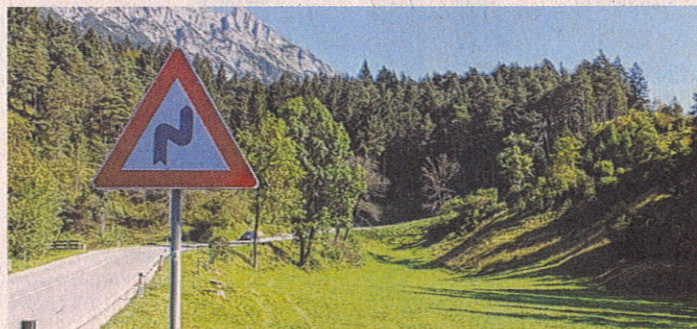
Eine Rampe soll die Kurve in Zukunft entschärfen.