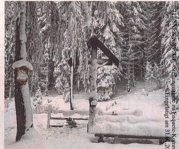
„Einstimmung auf die stille Zeit“ – Roland Geisberger hat die Idylle auf dem Weg nach Gleins fotografiert.