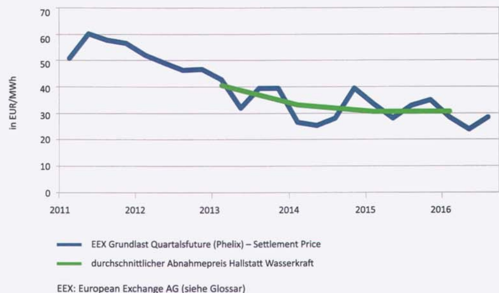
Abbildung 4: Entwicklung Marktpreis und Abnahmepreise der Hallstatt Wasserkraft GmbH