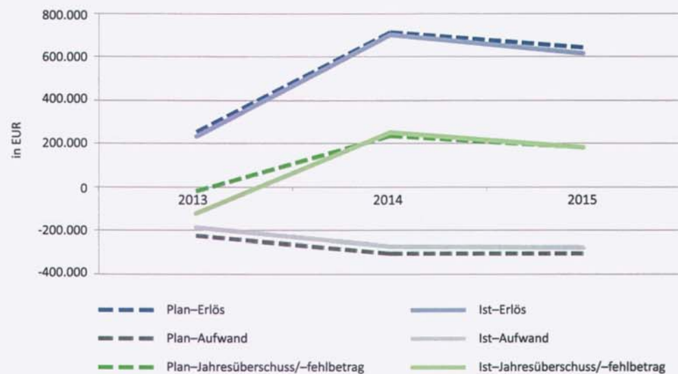
Abbildung 3: Soll-Ist-Vergleich zwischen den jährlichen Plandaten und den Jahresabschlüssen