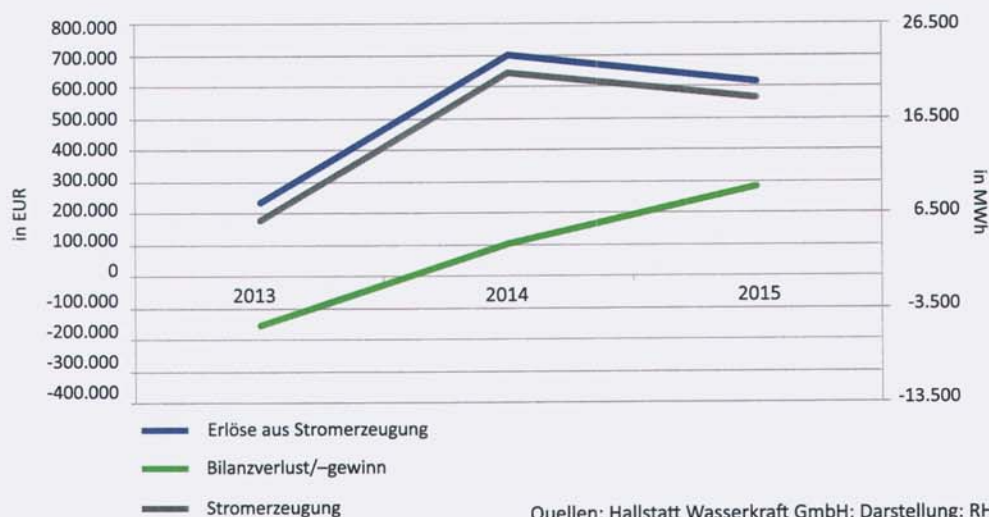
Abbildung 5: Erlösentwicklung versus Stromproduktion

Trotz der gesunkenen Strompreise (siehe Tabelle 9) erzielte die Gesellschaft in den ersten beiden Vollbetriebsjahren Bilanzgewinne von rd. 102.000 EUR (2014) bzw. rd. 286.000 EUR (2015).