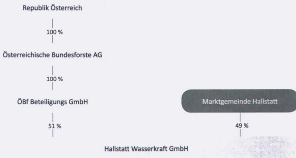
Abbildung 1: Eigentümerstruktur

Darstellung: RH