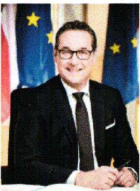
Heinz-Christian Strache Vizekanzler & Bundesminister für öffentlichen Dienst und Sport

Berufsbilder im Bundesdienst Der Aufgabenbereich der Bundesverwaltung ist äußerst breit gefächert. Videos über Berufe im Bundesdienst