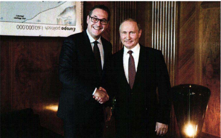
Staatsempfang für den russischen Präsidenten Wladimir Putin in Wien. → Zur Fotogalerie