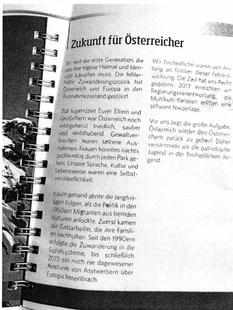
Abbildung 1 | Quelle:

Der Ring Freiheitlicher Jugend (RFJ) verteilte in Efering/Oberösterreich Druckwerke an SchülerInnen mit Inhalten, die Ressentiments gegen MigrantInnen schüren sollen. So heißt es im verteilten Kalender, die SchülerInnen müssten um „ihre eigene Heimat und Identität“ kämpfen, weil diese durch „Zuwanderungspolitik“ bedroht werde. Die Jugend der Eltern und Großeltern sei noch „weitgehend friedlich, sauber und wohlhabend“ gewesen. 1