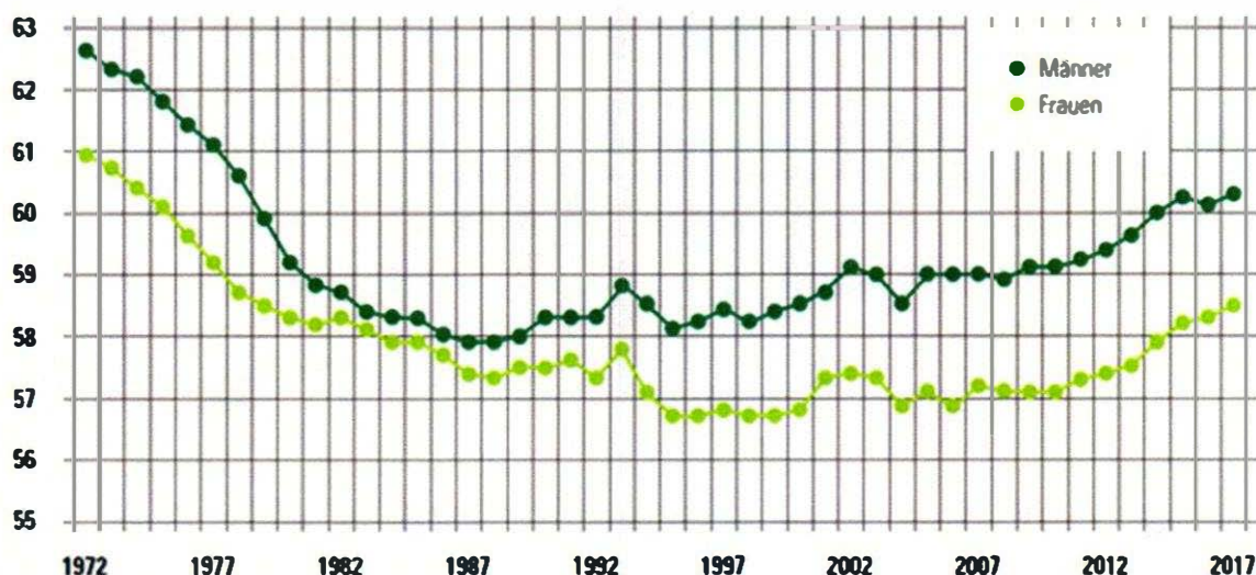
Durchschnittsalter der Neuzuerkennungen Pensionen und Rehabilitationsgeld in der gesamten Pensionsversicherung

Jahresbericht der österreichischen Sozialversicherung: https://www.sozialversicherung.at/cdscontent/load?contentid=10008.655412&version=1526990545