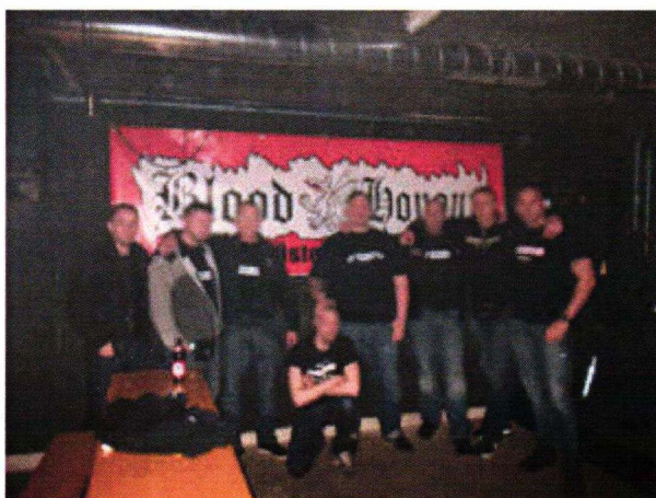
Nach dem Schießtraining posieren Neonazis vor einem Banner von Blood & Honour Österreich

Es traten die ungarische Band „Indulat“, die beiden Thüringer Bands „Kommando S3“ und „Unbeliebte Jungs“, sowie ein Liedermacher auf. 2