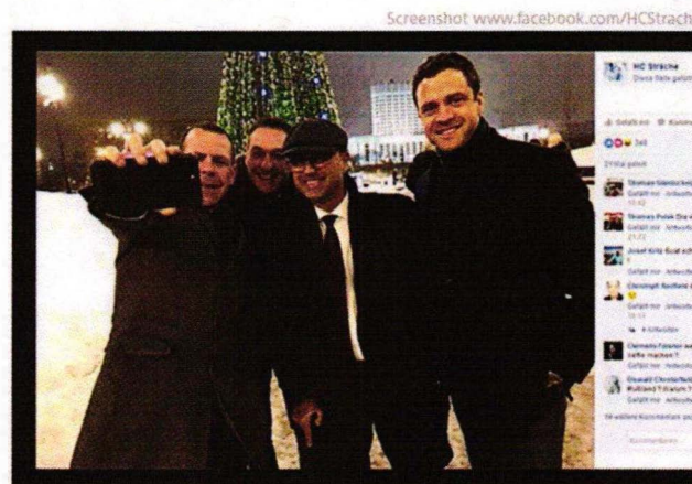
(Screenshot https://orf.at/v2/stories/2371678/2371680/ , vom 10.04.2019)