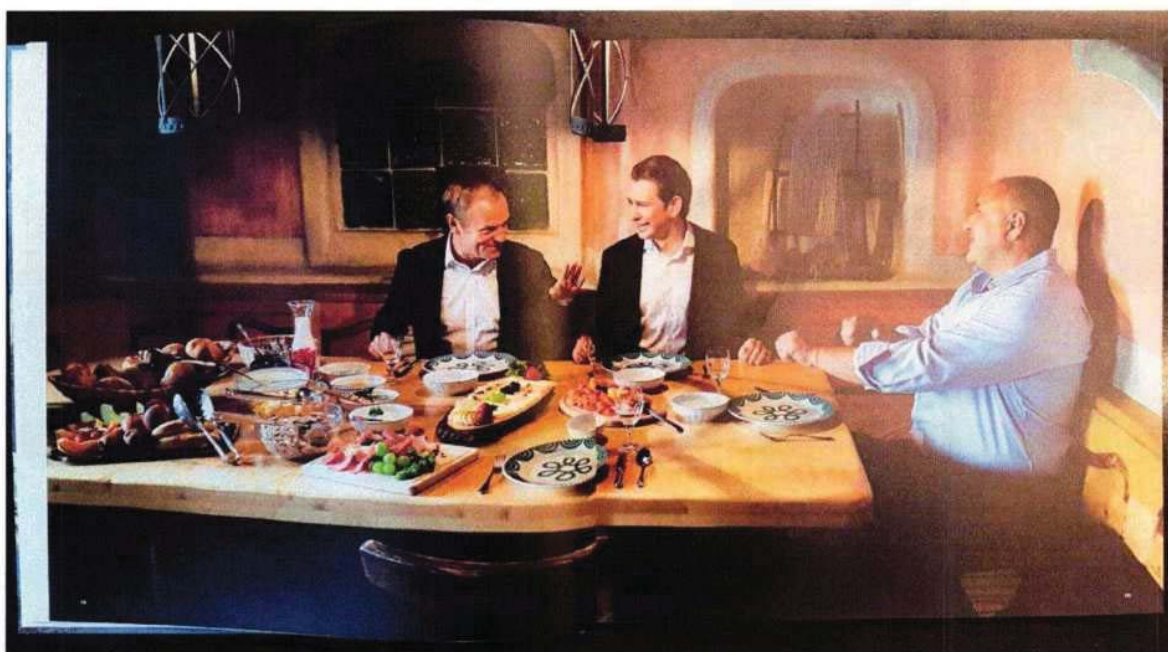
Donald Tusk, Sebastian Kurz und Boyko Borissov (Seite 14 und 15)

Die EU-Ratspräsidentschaft hat den Österreicherinnen und Österreichern mit 96,5 Millionen Euro fast doppelt so viel gekostet wie ursprünglich von der Regierung angekündigt (Online- Kurier, 18.3.). Damit diese „Spar-Präsidentschaft“ (Bundeskanzler Kurz) den Regierungsmitgliedern auch in netter Erinnerung bleibt, hat man sich ein Fotobuch anfertigen lassen, das auf 150 Seiten einen Einblick visueller Natur in die Präsidentschaft liefern soll. Weitgehend frei von Text - nur ein paar Tweets von ausschließlich konservativen und rechten PolitikerInnen zieren das Werk - wird in der Publikation „ EU2018.at - Austrian Presidency of the Council of the European Union “ nur 32 mal der österreichische Bundeskanzler abgelichtet. Was an sich ein informativer Bericht über die Tätigkeiten im Rahmen der österreichischen Ratspräsidentschaft sein könnte, entpuppt sich beim Durchblättern als zweckfreie Selbstbespiegelung, die vielleicht über die mangelnden inhaltlichen Fortschritte im Rahmen der Präsidentschaft hinwegtäuschen soll, aber jedenfalls zu den ausufernden Kosten der Präsidentschaft beigetragen hat.