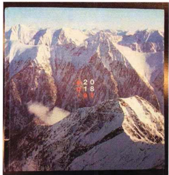
Titelbild des Fotobuches

Die unterzeichneten Abgeordneten richten daher an den Bundeskanzler nachstehende