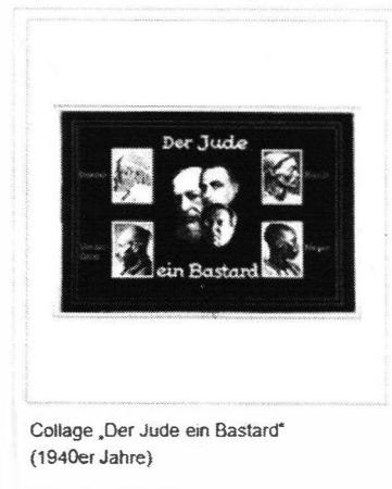
Abbildung 2 | Quelle: http://de.metapedia.org/wiki/J%C3%BCdische_Rasse (abgerufen am 6. März 2018)

Darstellung der Rassenmischung der Juden in „Das Judentum, seine blutsgebundene Wesensart in Vergangenheit und Gegenwart“: