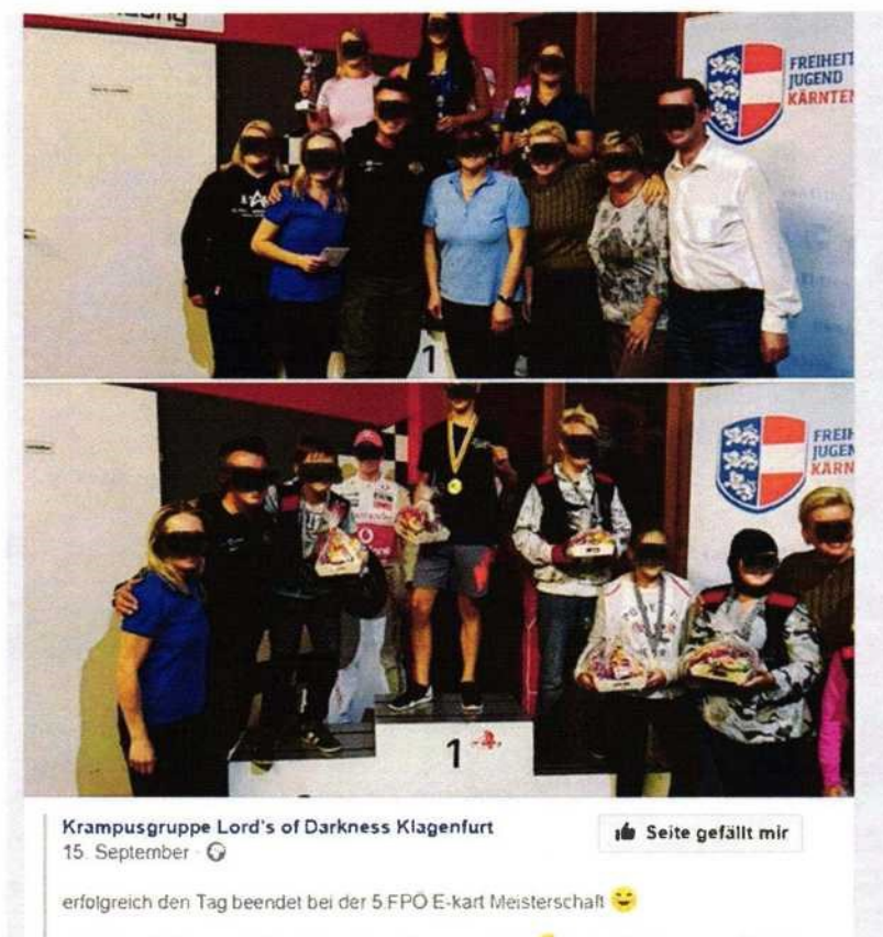
(Die Krampusgruppe bei der E-Kart Meisterschaft der FPÖ in Kärnten)