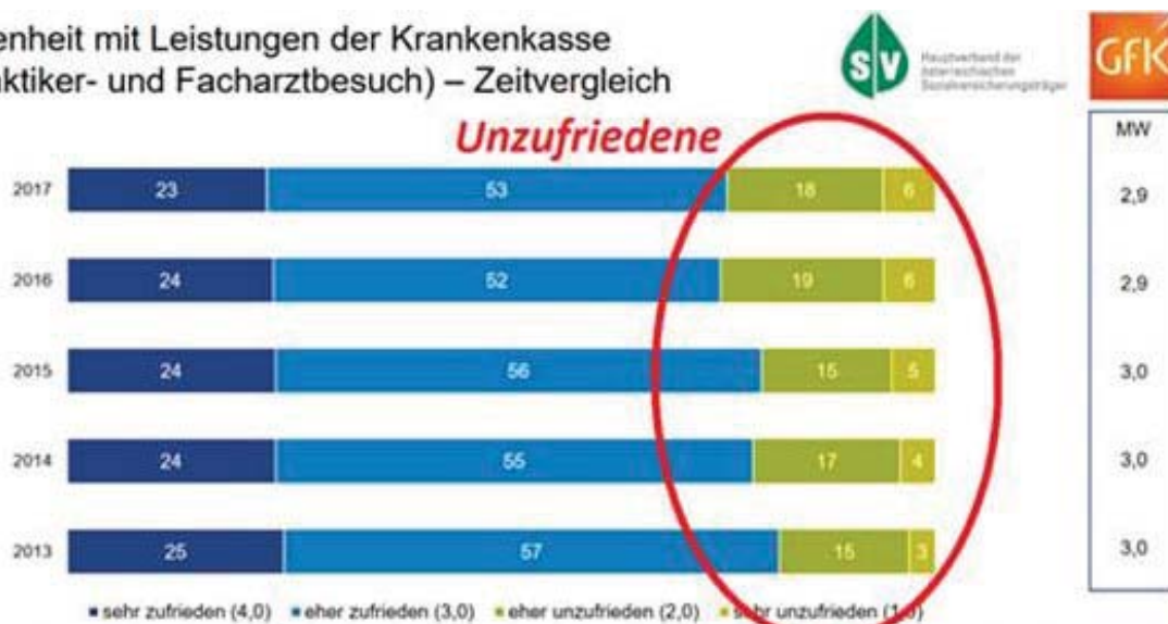
Zufriedenheit mit Leistungen der Krankenkasse (bei Praktiker- und Facharztbesuch) – Zeitvergleich

Frage: Wie zufrieden sind Sie mit den Leistungen, die die Krankenkasse für Sie übernimmt, wenn Sie zum praktischen Arzt/ zur praktischen Ärztin oder zum niedergelassenen Facharzt/zur niedergelassenen Fachärztin gehen? Basis: Total