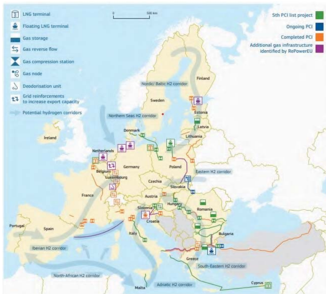
Karte der europäischen Strominfrastruktur