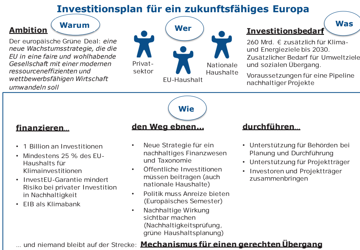
Abbildung 2 – Der Investitionsplan für ein zukunftsfähiges Europa

Der Investitionsplan für ein zukunftsfähiges Europa trägt zur Verwirklichung der Ziele für nachhaltige Entwicklung bei. Dies steht im Einklang mit der Zusage in der Mitteilung über den europäischen Grünen Deal, die Nachhaltigkeitsziele zum Hauptthema der Politikgestaltung und des politischen Handelns in der EU zu machen.