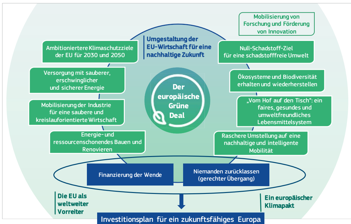
Abbildung 1 – Der Investitionsplan im Rahmen des europäischen Grünen Deals

Der Investitionsplan für ein zukunftsfähiges Europa wird den Übergang zu einer klimaneutralen, grünen Wirtschaft ermöglichen und dazu an den folgenden drei Stellen ansetzen: