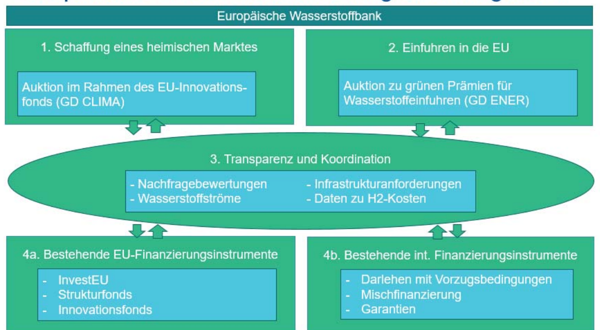
Abbildung 1. Die vier Säulen der Tätigkeiten im Zusammenhang mit der Europäischen Wasserstoffbank.

Die Bank wird eine wichtige Rolle spielen, da sie Investitionen des Privatsektors mobilisieren und zur frühzeitigen Schaffung von Märkten und zur Preisbildung beitragen wird, indem sie einen Wettbewerb um die Finanzierung schafft, das Vertrauen der Investoren stärkt und dem privaten Finanzsektor zu Wissen über die Projektfinanzierung verhilft.