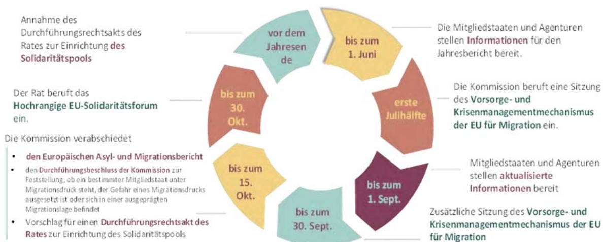
Abbildung 3: Jährlicher Migrationsmanagementzyklus

Viele der Maßnahmen, die zur Durchführung des Jährlichen Solidaritätszyklus erforderlich sind, müssen auf Unionsebene ergriffen werden. Die Kommission wird die entsprechenden Schritte unternehmen, die für den ersten jährlichen Migrationsmanagementzyklus erforderlich sind, und alle erforderlichen rechtlichen, administrativen und operativen Maßnahmen ergreifen, um sicherzustellen, dass jeder Schritt des jährlichen Zyklus reibungslos funktioniert, einschließlich der Umsetzung des ersten Jährlichen Solidaritätspools, den der Rat Ende 2025 annehmen muss .