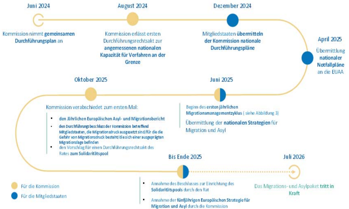
Abbildung 1: Zeitplan für die wichtigsten Etappenziele während des zweijährigen Durchführungszeitraums