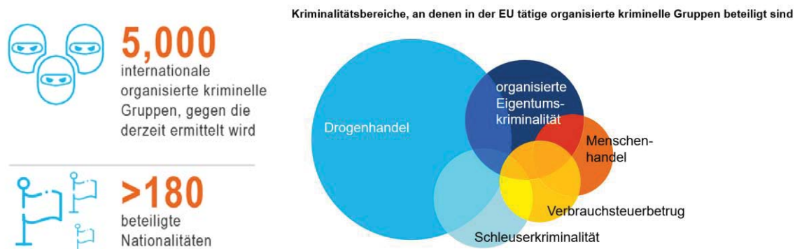
Bewertung der Bedrohungslage im Bereich der schweren und organisierten Kriminalität (SOCTA) (Europol, 2017)

Die organisierte Kriminalität ist auf dem Vormarsch, operiert zunehmend grenzüberschreitend und verlagert sich ins Internet.