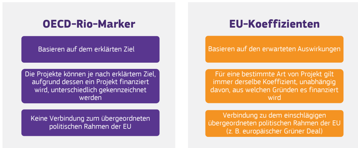
Kasten 6 – Von den Rio-Markern der OECD zu EU-Koeffizienten

Das Rio-Marker-System der OECD weist jedem Projekt einen Marker zu, je nachdem, ob es aus klimapolitischen Erwägungen finanziert wird – Hauptrelevanz/100 % –, ob es aus anderen Gründen finanziert wird, aber einen signifikanten, positiven Beitrag – erhebliche Relevanz/40 % – oder keinen Beitrag leistet – keine Relevanz/0 %. Dieses System ist mit geringen Verwaltungskosten einfach zu nutzen, da die Projekte nach den Gründen ihrer Finanzierung kategorisiert werden, ohne dass ein tieferes Verständnis ihrer Auswirkungen erforderlich ist.