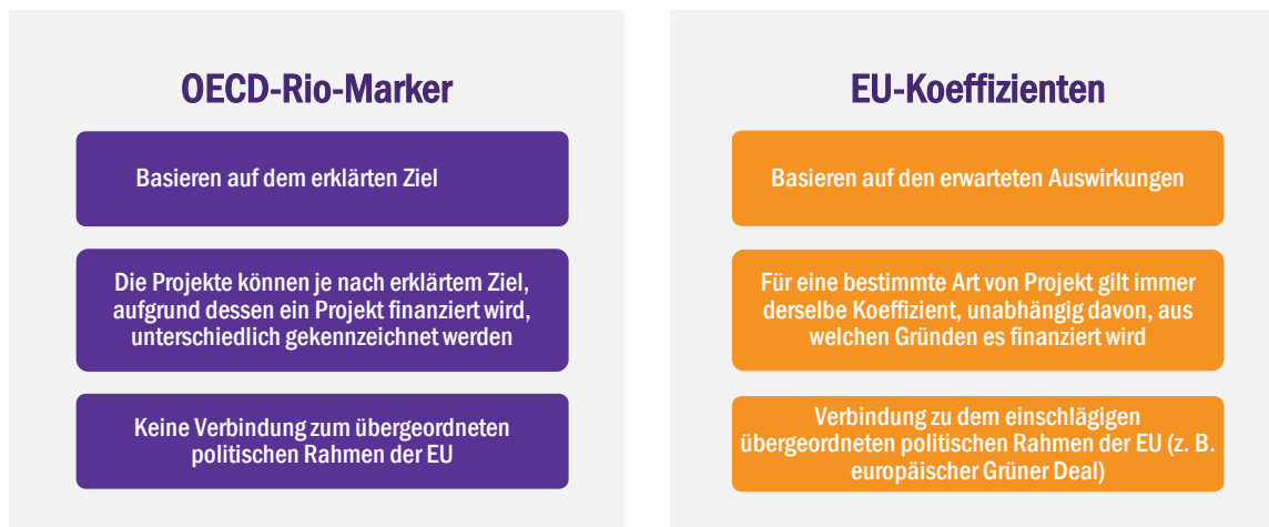
Kasten 6 – Von den Rio-Markern der OECD zu EU-Koeffizienten

Das Rio-Marker-System der OECD weist jedem Projekt einen Marker zu, je nachdem, ob es aus klimapolitischen Erwägungen finanziert wird – Hauptrelevanz/100 % –, ob es aus anderen Gründen finanziert wird, aber einen signifikanten, positiven Beitrag – erhebliche Relevanz/40 % – oder keinen Beitrag leistet – keine Relevanz/0 %. Dieses System ist mit geringen Verwaltungskosten einfach zu nutzen, da die Projekte nach den Gründen ihrer Finanzierung kategorisiert werden, ohne dass ein tieferes Verständnis ihrer Auswirkungen erforderlich ist.