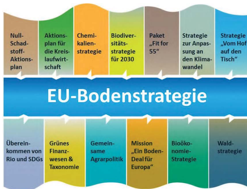
Abbildung 1: Verbindungen zwischen der EU-Bodenstrategie und anderen EU-Initiativen

Um die Vorteile gesunder Böden für Menschen, Lebensmittel, Natur und Klima zu nutzen, braucht die EU eine neue Bodenstrategie, die einen Rahmen und konkrete Maßnahmen für Schutz, Wiederherstellung und nachhaltige Nutzung von Böden vorgibt und darüber hinaus das erforderliche gesellschaftliche Engagement und die benötigten Finanzmittel mobilisiert, den Wissensaustausch in Gang setzt und nachhaltige Methoden sowie Überwachung fördert, um gemeinsame Ziele zu erreichen. Die Strategie ist eng mit den anderen politischen Maßnahmen der EU, die sich aus dem europäischen Grünen Deal ergeben, verknüpft und wirkt mit ihnen zusammen. Sie wird unsere Ambitionen für weltweite Maßnahmen für den Boden auf internationaler Ebene untermauern. Dies kann nur durch eine Kombination neuer freiwilliger und rechtsverbindlicher Maßnahmen erreicht werden, die nachstehend vorgestellt werden und unter uneingeschränkter Wahrung der Subsidiarität und auf der Grundlage den bestehenden nationalen politischen Strategien für den Boden entwickelt wurden.