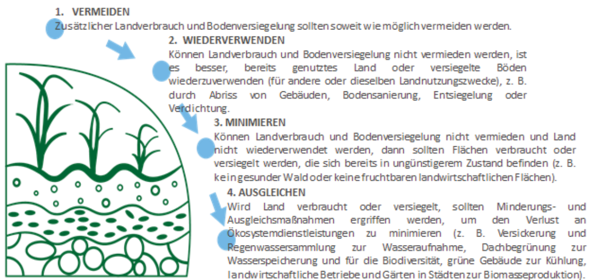
Abbildung 2: Flächenverbrauchshierarchie

Da einige Mitgliedstaaten stärker für extreme Wetterereignisse und andere externe Effekte anfällig sind, haben sie Zielevorgaben für die Verringerung des Flächenverbrauchs festgelegt 51 , allerdings mit uneinheitlichen Ergebnissen. Flächenrecycling, d. h. die erneute Bebauung oder die Sanierung von zuvor bereits bebauten Flächen, machte (zwischen 2006 und 2012) nur 13,5 % der städtischen Entwicklung in der EU aus 52 . Es besteht also Verbesserungspotenzial. Tatsächlich haben einige Mitgliedstaaten Quoten von über 50 % und bis zu 80 % erreicht, was zeigt, dass ein nachhaltiges Flächenrecycling möglich ist. So bleiben natürliche Flächen zum Nutzen der biologischen Vielfalt, Wälder und Grünflächen, Flächen für die Lebensmittel- und Biomasseerzeugung, Wasser- und Niederschlagsregulierung verschont. Daher muss bei der Flächennutzungsplanung eine Hierarchie angewandt werden.