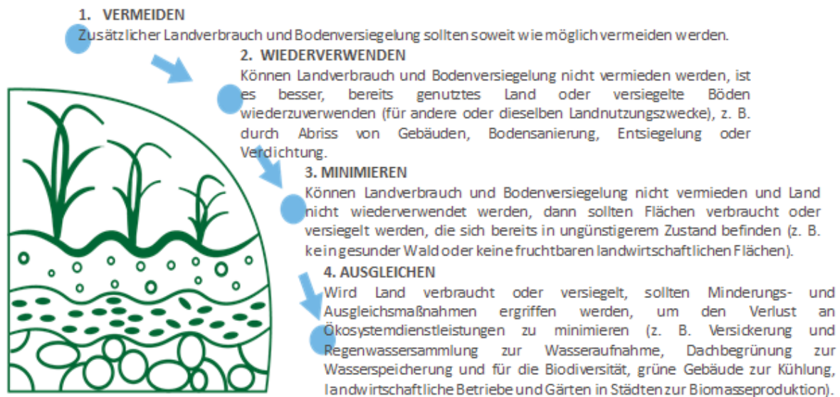
Abbildung 2: Flächenverbrauchshierarchie