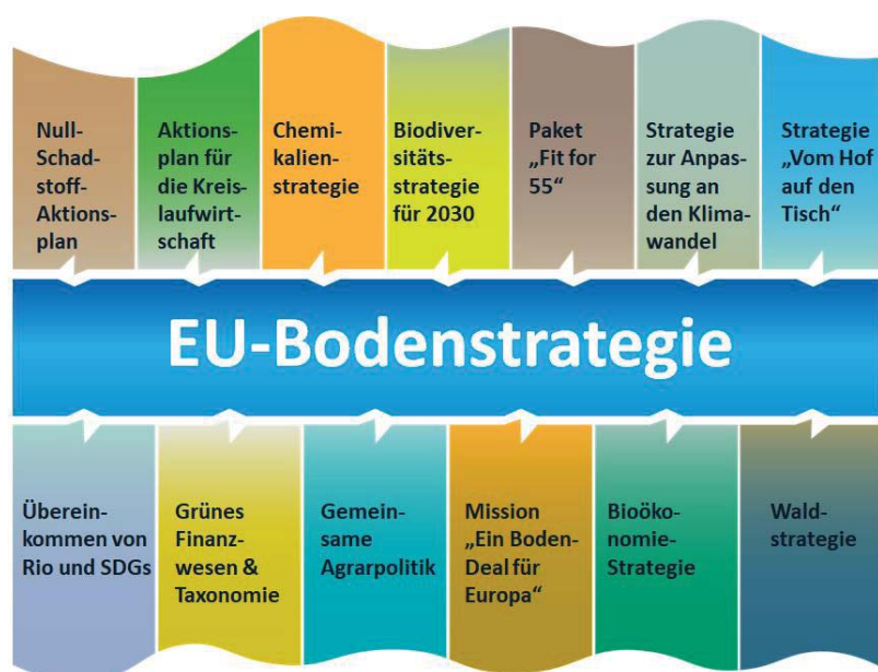
Abbildung 1: Verbindungen zwischen der EU-Bodenstrategie und anderen EU-Initiativen