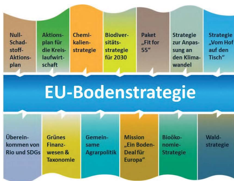
Abbildung 1: Verbindungen zwischen der EU-Bodenstrategie und anderen EU-Initiativen