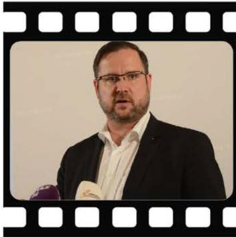
Christian Hafenecker Fraktionsvorsitzender

„Um einen tiefen Staat zu errichten und wesentliche Institutionen der Republik politisch zu missbrauchen, benötigt man drei Säulen: das Innenministerium, die Justiz und die volle Kontrolle über die Finanzen. All das hat sich die ÖVP seit Jahrzehnten gesichert. Der „Ibiza-Untersuchungsausschuss“ ist daher nur der Beginn eines Prozesses, der den Bürgern ihren Staat wieder zurückzugeben soll. Das wird ein hartes Stück Arbeit, dem sich die FPÖ aber jedenfalls stellen wird!“