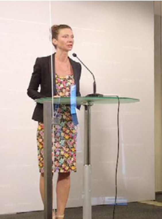
Nationalratsabgeordnete und Untersuchungsausschuss-Fraktionsmitglied Dr. Susanne Fürst beim morgentlichen Pressestatement