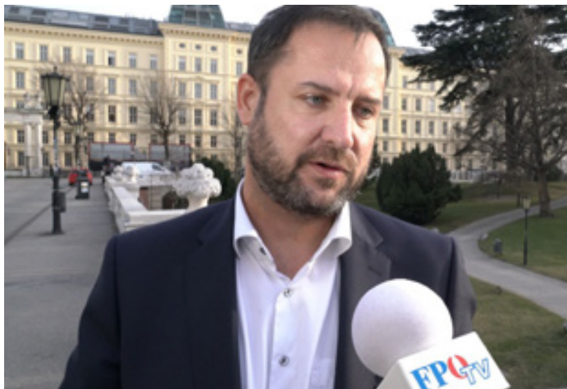
Christian Hafenecker, MA, Nationalratsabgeordneter und freiheitlicher Fraktionsführer im Untersuchungsausschuss bei einem der unzähligen Interviews