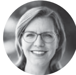
Leonore Gewessler, BA Bundesministerin für Klimaschutz, Umwelt, Energie, Mobilität, Innovation und Technologie