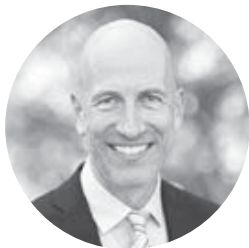
Univ.-Prof. Dr. Martin Kocher Bundesminister für Arbeit und Wirtschaft