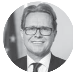
Ao. Univ.-Prof. Mag. Dr. Martin Polaschek Bundesminister für Bildung, Wissenschaft und Forschung