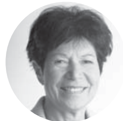
em. Univ.-Prof.in Dr.in Helga Nowotny Ehemalige Präsidentin des Europäischen Forschungsrates