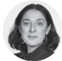
Dr.in Klara Sekanina Vorsitzende (bis September 2022) Direktorin der Schweizerischen Studienstiftung