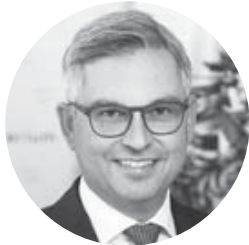
Dr. Magnus Brunner, LL.M. Bundesminister für Finanzen