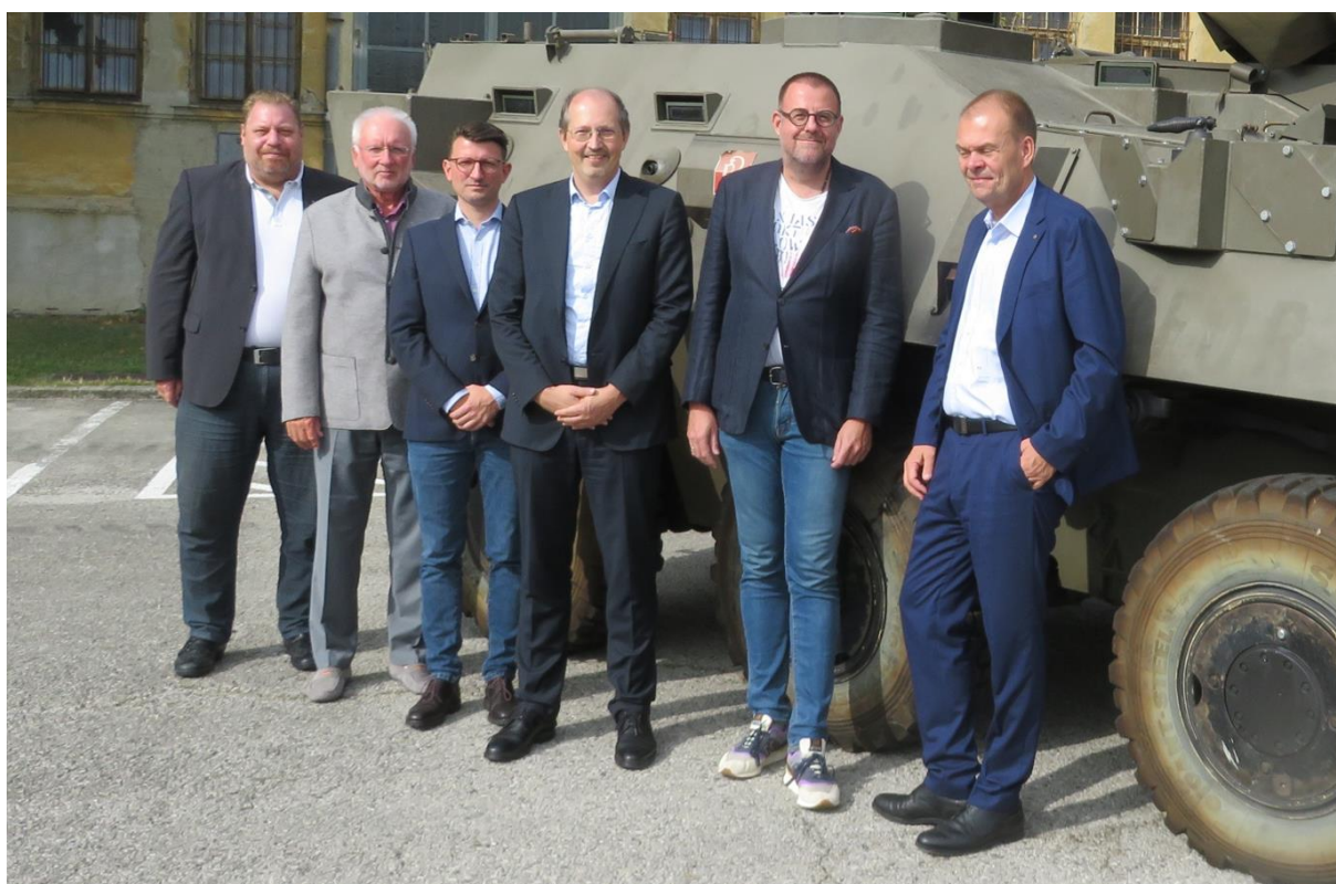
Mitglieder der Beschaffungs-Prüfkommission, Klausur vom 29. September – 1. Oktober 2023, Wien/Breitensee