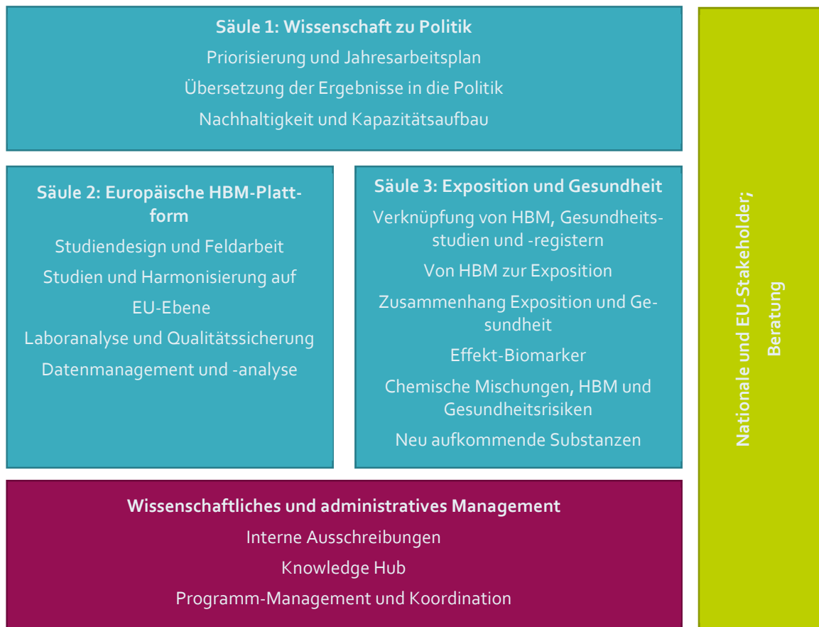
Abbildung 2: Die Struktur von HBM4EU (erstellt basierend auf HBM4EU (2019a))