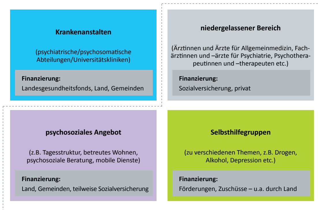
Abbildung 1: Versorgungslandschaft für psychisch kranke Menschen in Kärnten und Tirol – Überblick