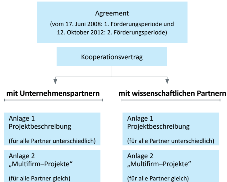
Abbildung 3: Vertragsbeziehungen und –gestaltung der LCM GmbH