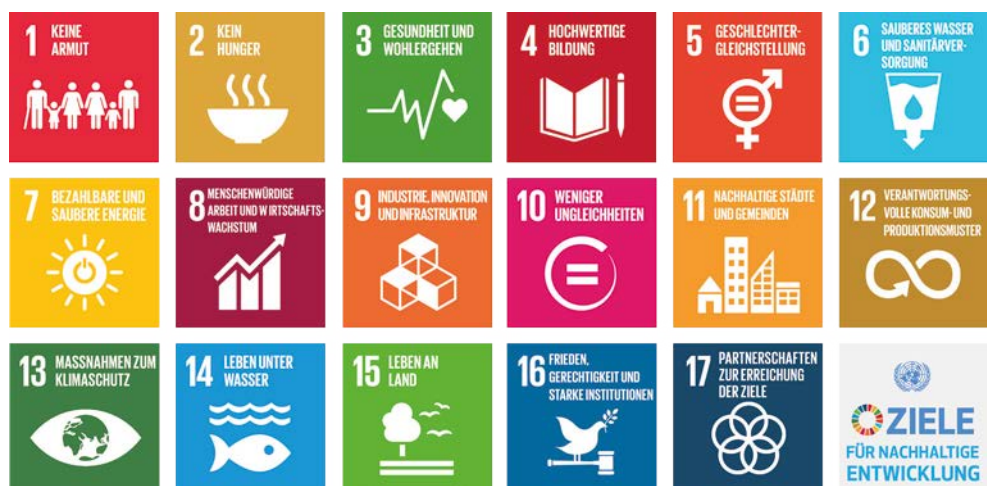
Abbildung 1: Die nachhaltigen Entwicklungsziele der Agenda 2030

Die nachhaltigen Entwicklungsziele bauen auf den Millenniums-Entwicklungszielen von 2000 bis 2015 auf, gehen aber sowohl in ihrem Inhalt als auch in ihrem Anwendungsbereich wesentlich über diese hinaus. Während sich die Millenniums-Entwicklungsziele nur auf Entwicklungsländer bezogen und klassische „Armutskämpfungsziele“ beinhalteten, sind die nachhaltigen Entwicklungsziele umfassend und universell anwendbar. Sie betreffen und richten sich an alle Mitgliedstaaten der Vereinten Nationen und umfassen dabei ökologische, ökonomische und soziale Ziele.